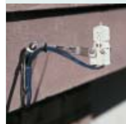
Compatibile con sensore meteorologico