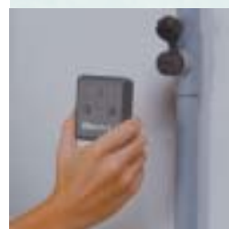
Opzione di programmazione con PC